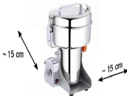
Рис.4 – Регламентированная установка оборудования (размещение на рабочей поверхности) до сторонних предметов или стен.

Необходимое пространство для эксплуатации. Указаны предельные расстояние до соседнего оборудование или стен помещения. Рис. 4